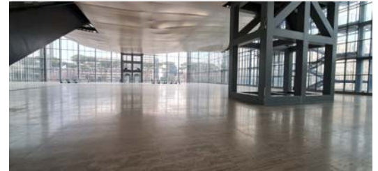
AREA ESPOSITIVA FORUM