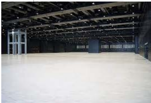
AREA ESPOSITIVA LEVEL-1