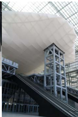
FOYER - AREA REGISTRAZIONE